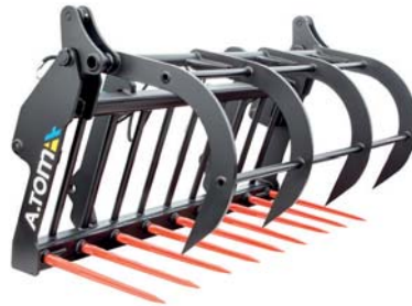
ЗАХВАТ ДЛЯ КОМПОСТУ ТМ «А.ТОМ»