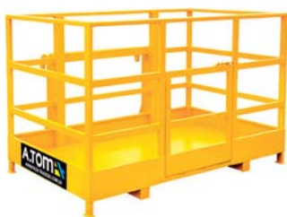
РОБОЧА ПЛАТФОРМА (ЛЮЛЬКА) ТМ «А.ТОМ»