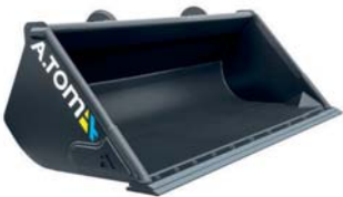
*Ківш Evolution Ніж HARDOX 450 + змінний ніж HARDOX 450