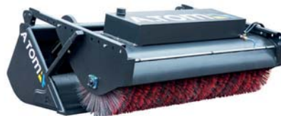
ЦІТКА-НАКЛАДКА (БЕЗ КІВША) ТМ «А.ТОМ»