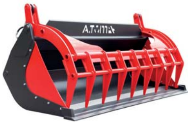
КІВШ ДЛЯ КОМПОСТУ ТМ «А.ТОМ»