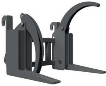
ЗАХВАТ ДЛЯ КОЛОД ТМ «А.ТОМ»