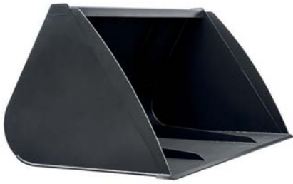
КІВШ «А.ТОМ» Economy