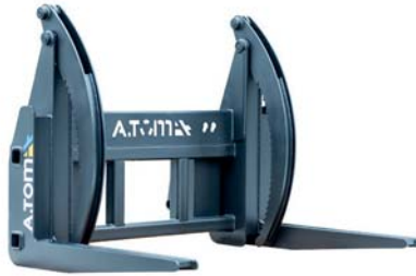
ЗАХВАТ ДЛЯ КОЛОД ТМ «А.ТОМ»