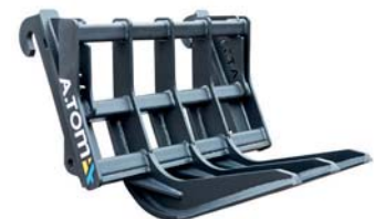
ВИКОРЧОВУВАЧ ТМ «А.ТОМ»