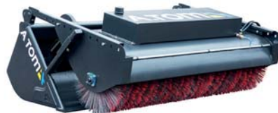
ЩІТКА-НАКЛАДКА (БЕЗ КІВША) ТМ «А.ТОМ»