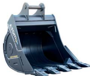
КІВШ ЕКСКАВАТОРНИЙ ТМ «А.ТОМ»