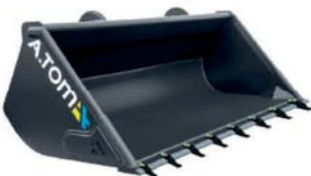
*Ківш Evolution Ніж 09Г2С + коронки