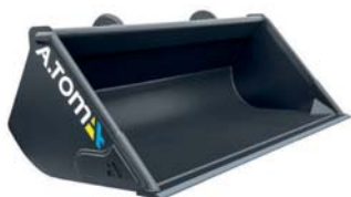
*Ківш Evolution Ніж HARDOX 450