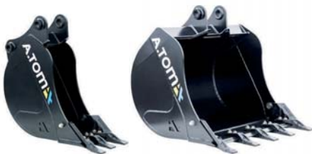
КІВШ ЕКСКАВАТОРНИЙ ТМ «А.ТОМ»