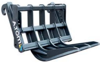
ВИКОРЧОВУВАЧ ТМ «А.ТОМ»