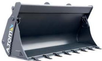
КІВШ БАГАТОФУНКЦІОНАЛЬНИЙ ТМ «А.ТОМ»