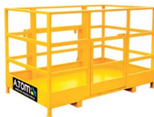
РОБОЧА ПЛАТФОРМА (ЛЮЛЬКА) ТМ «А.ТОМ»