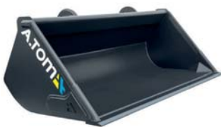
*Ківш Evolution Ніж HARDOX 450