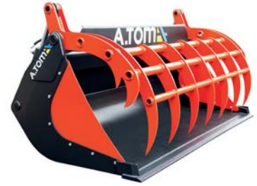
КІВШ ДЛЯ СИЛОСУ ТМ «А.ТОМ»