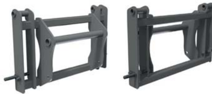
АДАПТЕР JCB↔MANITOU ТМ «А.ТОМ»