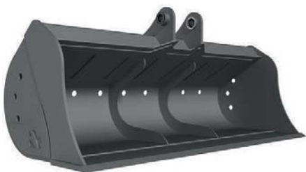
КІВШ ПЛАНУВАЛЬНИЙ ЕКСКАВАТОРНИЙ ТМ «А.ТОМ»