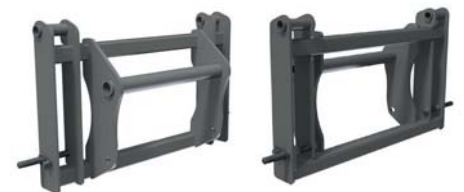
АДАПТЕР JCB↔MANITOU ТМ «А.ТОМ»