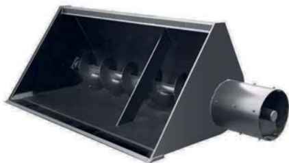
КІВШ-КОРМОРОЗДАТЧИК ТМ «А.ТОМ»