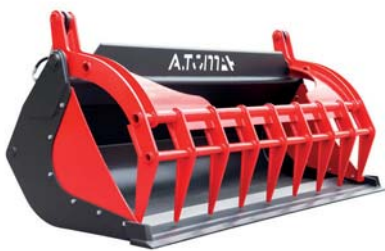
КІВШ ДЛЯ КОМПОСТУ ТМ «А.ТОМ»