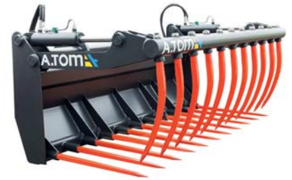
ЗАХВАТ ДЛЯ СІНА ТМ «А.ТОМ»