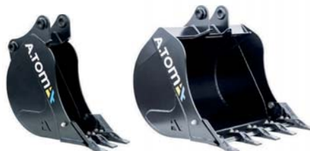
КІВШ ЕКСКАВАТОРНИЙ ТМ «А.ТОМ»