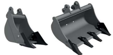
КІВШ НА МІНІ-ЕКСКАВАТОР ТМ «А.ТОМ»