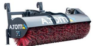
ЩІТКА-ДОРОЖНЯ ТМ «А.ТОМ»