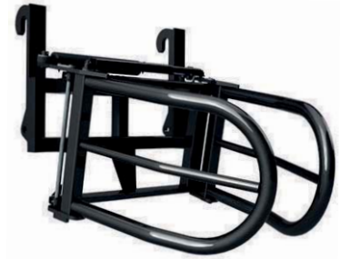
ЗАХВАТ ДЛЯ ТЮКІВ ТМ «А.ТОМ»