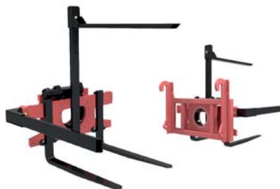
РОТАТОР ТМ «А.ТОМ»