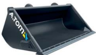
*Ківш Evolution Ніж HARDOX 450 + змінний ніж HARDOX 450