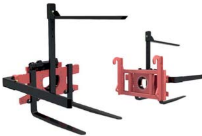
РОТАТОР ТМ «А.ТОМ»