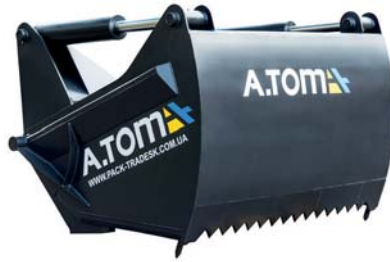
НІЖ/ЗАХВАТ ДЛЯ СИЛОСУ ТМ «А.ТОМ»