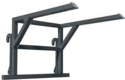
ЗАХВАТ ДЛЯ БІГ-БЕГІВ ТМ «А.ТОМ»